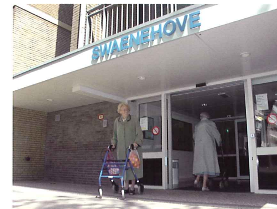
Veiligheid voor medewerker én cliënt.