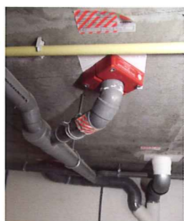
Brandwerende doorvoeren in brandscheidingen.

HET NIEUWE KEURMERK 'BRANDVEILIG GEBOUW' EN DE BEGELEIDENDE REGELING BRANDVEILIG GEBRUIK BOUWWERKEN (BGB) WORDEN LANDELIJK INGEVOERD. NA GESTART TE ZIJN IN DE ZORG VOLGEN ANDERE SECTOREN. DE BGB BENADERT DE BRANDVEILIGHEID INTEGRAAL. EEN GEBOUW MOET VANUIT BOUWKUNDIGE INVALSHOEK VEILIG ZIJN, DE INSTALLATIES MOETEN DEUGEN EN ORGANISATORISCH MOET ALLES KLOPPEN. KIWA RICHT DE CERTIFICATIEREGELING IN.